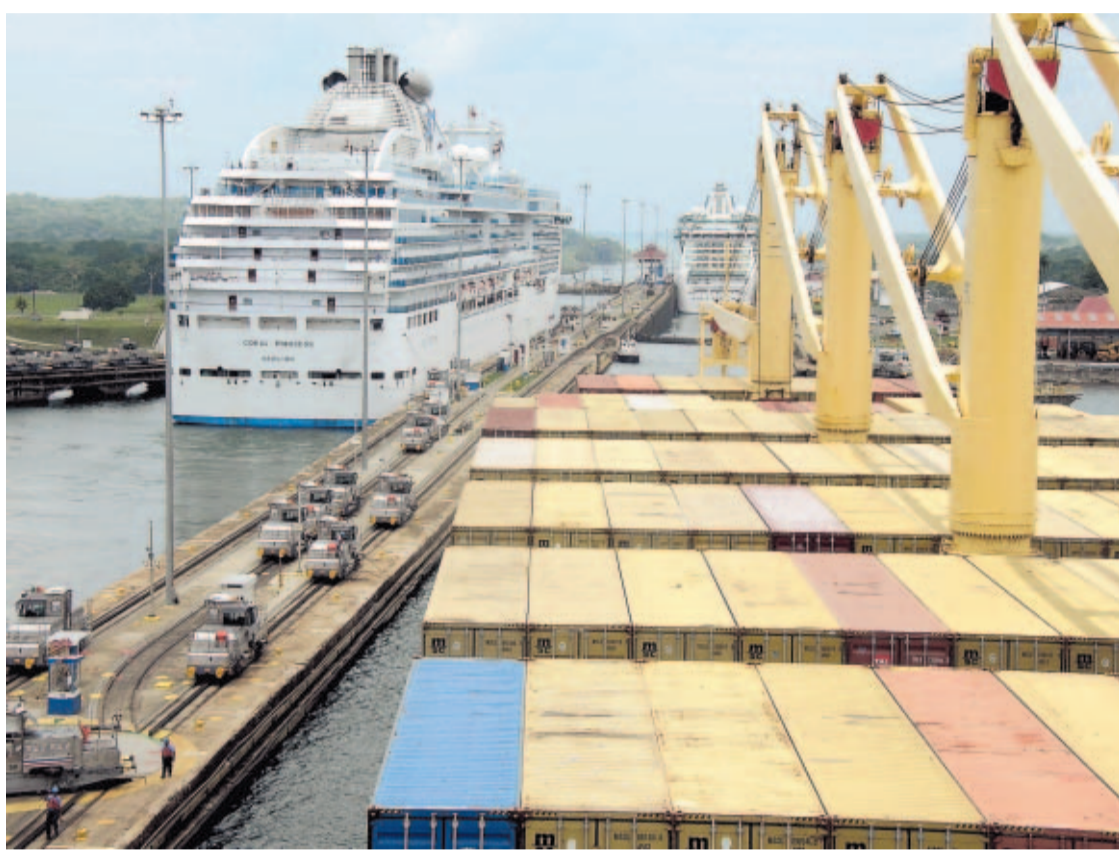
DEMANDA. En horas de la mañana se atiende el tránsito de los buques en dirección norte por ambos carriles de la esclusa de Gatún.