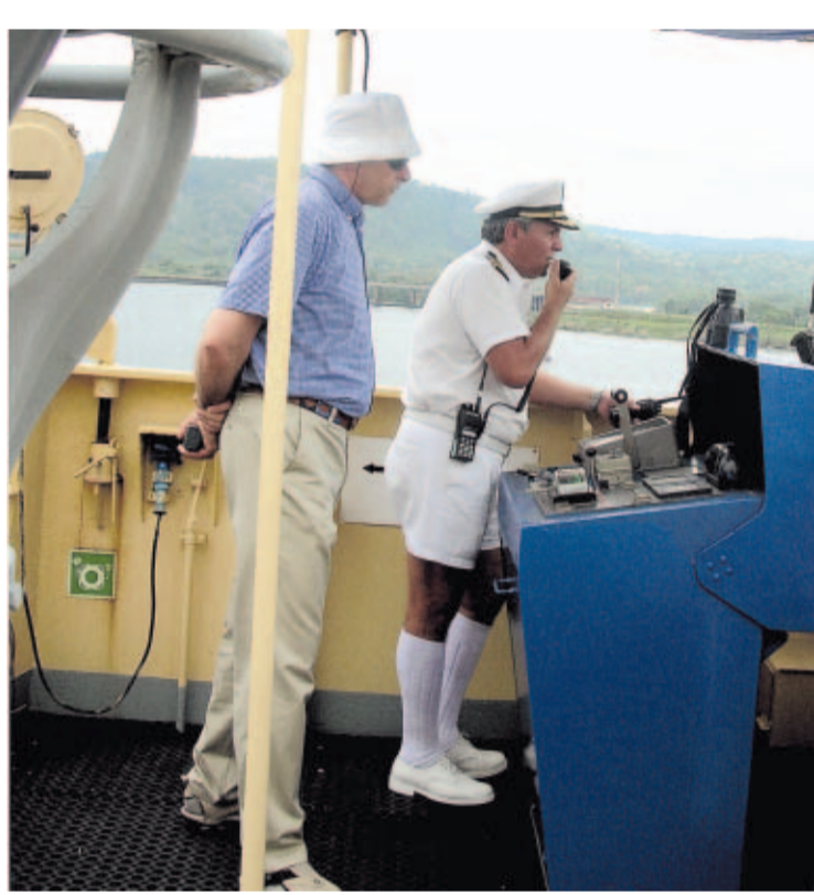
MANDO. Una vez ingresan en el Canal los capitanes de los navíos ceden el mando a prácticos panameños.

"iFull ahead!" repite Bakaric, indicándole al timonel del buque que marche hacia adelante. Dos remolcadores de 4 mil 800 caballos de fuerza cada uno, y seis locomotoras de 70 mil libras de presión ca-