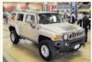
PASE A LA 46A