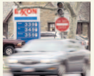
PASE A LA 61A