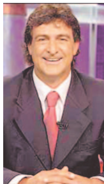
Mario Alberto Kempes